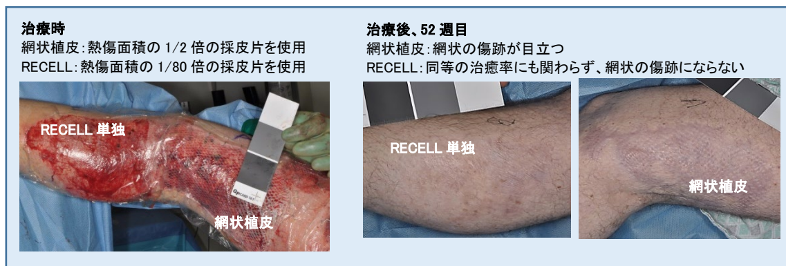
図2: 米国の臨床試験より:同一患者にて、RECELL 単独治療と 2 倍網状植皮の治療